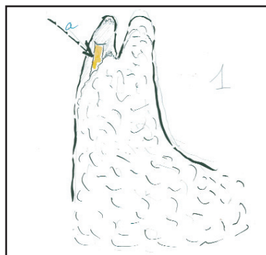
Figure 1 : Ablation d'un neurinome de l'acoustique droit par voie trans-labyrinthique, découverte du nerf facial à l'orifice du canal de Fallope (flèche a).

Le repérage du nerf facial est réalisé à son émergence du tronc cérébral (Figure 2). Ceci nécessite dans les tumeurs volumineuses le morcellement intratumoral