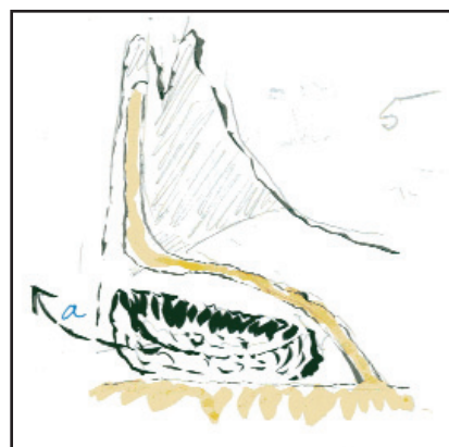
Figure 5 : Nerf facial préservé ablation du fragment postérieur du neurinome (flèche a).

On procède alors à la dissection du nerf facial au pôle antérieur du neurinome. Ce temps est très long, nécessitant de morceler l'intérieur du neurinome tout en séparant très progressivement le nerf facial jusqu'à rejoindre le segment périphérique du nerf qui avait été disséqué précédemment jusqu'au porus (Figure 4). Dans cette dernière dissection du nerf, l'HD et le monitoring sont particulièrement utiles ; on évite ainsi toute traction sur le nerf et on aboutit enfin à l'ablation du fragment antérieur de la tumeur et à la libération du nerf facial. Quelques millimètres de tumeur peuvent en cet endroit y demeurer adhérents si le risque d'interruption du nerf paraît inéluctable en poursuivant obstinément leur ablation. Le risque de récurrence en cet endroit y est d'ailleurs négligeable.